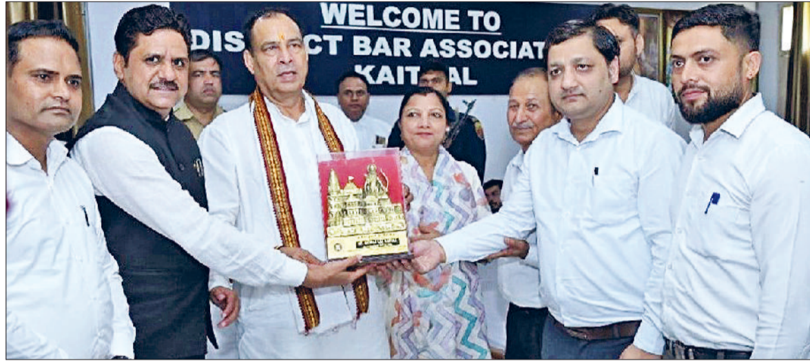
कैथल। मोहन लाल बड़ौली का स्वागत करते हुए कार्यकारिणी सदस्य।

भाजपा प्रदेश अध्यक्ष मोहनलाल बड़ौली ने कहा कि आम जनता को न्याय दिलाना भी सेवा का काम है। वकील अपने तरीके से समाज सेवा करते हैं। मोहनलाल बड़ौली आज बार परिसर में जिला बार एसो द्वारा उनके सम्मान में आयोजित कार्यक्रम में बोल रहे थे। कहा कि 17 सितंबर से 2 अक्टूबर तक भाजपा द्वारा सेवा पखवाड़ा मनाया जा रहा है। उन्होंने वकीलों से अपील की कि वे भी इस दौरान अपने मुक्किलों की प्री सेवा करें। वकीलों का समाज की सेवा में बड़ा योगदान है। कहा कि हरियाणा में लगातार तीसरी बार भाजपा की सरकार बनी है, इसमें भी वकीलों के योगदान से इंकार नहीं किया जा सकता। भाजपा सत्ता नहीं बल्कि