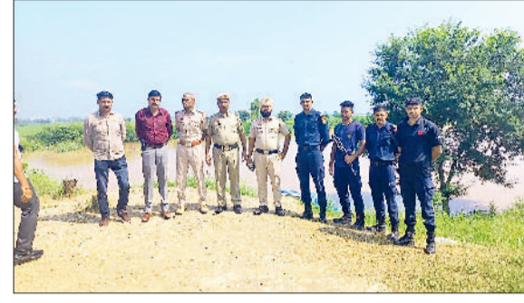
ब्रह्म शक्ति आश्रम में स्थापित पुलिस फ्लड वार्निंग स्टेशन पर कर्मचारी।