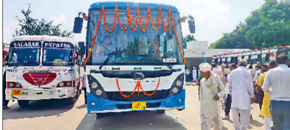
जीद। सफीदों से दिल्ली के लिए रवाना होती एसी बस।