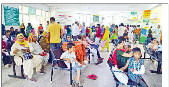
जीद। नागरिक अस्पताल में ओपीडी के लिए आए मरीज व तैयारदार। व नागरिक अस्पताल में दवाई के लिए लाइन में लगे लोग।

लगातार बारिश के मौसम के बाद अब पिछले दो दिनों से घुप निकल रही है। ऐसे में मौसम उमस भरा रह रहा है। दिन के समय गर्मी व रात के समय ठंड का अहसास होने का असर अब मानव शरीर पर होने लगा है। इस समय सर्दी, जुखाम, बुखार, गला खराश व एलर्जी के मरीजों की संख्या बढ़ गई है। जिला मुख्यालय स्थित नागरिक अस्पताल, निजी