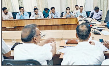
जीट। बैठक की अध्यक्षता करते डीसी।