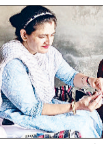
जीद। नगरां गांव में महिला के खून की जांच करती स्वास्थ्य कर्मचारी।