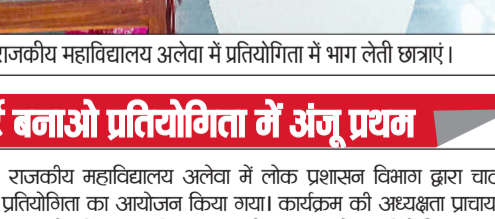
अलेवा। राजकीय महाविद्यालय अलेवा में प्रतियोगिता में भाग लेती छात्राएं।