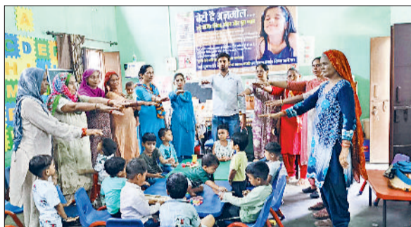
राजौंद। कार्यक्रम में भाग लेती हुई स्वास्थ्य विभाग की कर्मचारी व महिलाएं।