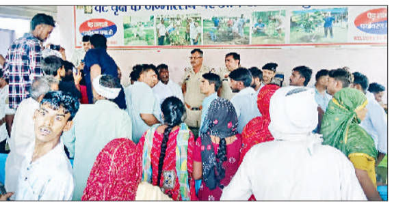
जींद। परिजनों से बातचीत करते पुलिसकर्मी।