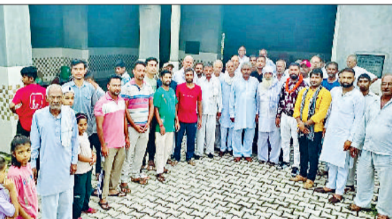
जीट। बैठक में भाग लेते हुए।

जीट। लघु सचिवालय के समागार ने उपायुक्त मोहम्मद इमरान रजा की अध्यक्षता में सीएम घोषणाओं की प्रतिक्रिया में समीक्षा बैठक आयोजित की गई। बैठक में विभागवार प्रोजेक्ट्स की स्थिति पर विस्तार से विचार विमर्श किया गया और संबंधित अधिकारियों से अपडेट ली। उपायुक्त मोहम्मद इमरान रजा ने कहा कि मुख्यमंत्री की घोषणाएं सरकार की प्राथमिकता हैं इसलिए सभी अधिकारी इन्हें गंभीरता से लेते हुए निष्पक्ष समीक्षा में पूरा करना सुनिश्चित करें। उपायुक्त मोहम्मद इमरान रजा ने कहा कि अनावश्यक ढंग से बर्बाद नहीं किया जाएगा। पौडियां कार्यों की रिपोर्ट निष्पक्ष समीक्षा में गंभीर प्रस्तुत करने के निर्देश दिए गए। विभागवार समीक्षा में अधिकारियों को प्रत्येक प्रोजेक्ट्स 75 प्रतिशत तक पूर्ण हो चुके हैं। उपायुक्त ने अधिकारियों को शेष कार्यों में तेजी लाने और समयबद्ध तरीके से पूरे करने पर जोर दिया। जिन प्रोजेक्ट्स का कार्य पूरा हो चुका है, उनको रिपोर्ट तुरंत जमा करवाया जाए। साथ ही सभी प्रोजेक्ट्स का निष्पक्ष फॉलोअप करने और प्रगति विवरण साझा करने के भी निर्देश दिए।