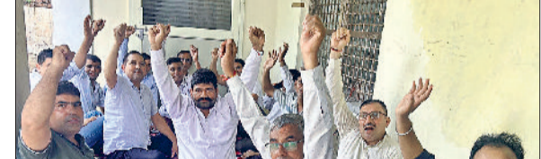
जींद। मांगों को लेकर धरना देते बिजली कर्मचारी यूनियन नेता।

ग्राम पंचायत प्रतिनिधियों की समस्या पर संज्ञान लेते हुए एसडीएम ने कहा कि उपमंडल के कई गांवों में फसल प्रभावित हुई है साथ ही कई गांवों के खेतों में वर्तमान में जल भराव ज्यादा है। उन्होंने कहा कि प्रशासन लगातार आपदा का इस घड़ी में प्रभावित लोगों को राहत पहुंचाने के लिए प्रयासरत है। उन्होंने कहा कि किसानों की फसलों के नुकसान को भरपाई के लिए सरकार द्वारा फैसला लिया गया है। इसके लिए ई क्षतिपूर्ति पोर्टल खोला गया है। प्रभावित किसान अपने नुकसान का ब्यौता पोर्टल पर अपलोड कर सकते हैं। एसडीएम ने आगे कहा कि संकट की इस घड़ी में आपसी तालमेल और धैर्य बनाए रखने की जरूरत है। प्रशासन तथा आमजन मिलजुल कर ही आपदा की इस घड़ी से पार पा सकते हैं। राहत एवं बचाव कार्य निरंतर जारी है।