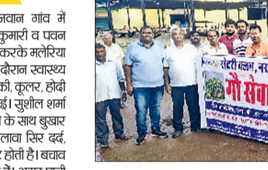
नरवाना। गांवों को हरा चारा खिलाते हुए।