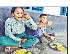
दिया जाता है। इसके तहत बच्चों को सप्ताह में दो दिन बच्चों को फ्लेवर्ड मिल्क भी दिया जाता है। वहीं अब मौलिक निदेशालय ने अब मील योजना के तहत बच्चों को प्रोटीन

राजकीय विद्यालयों में बाल वाटिका से आठवीं तक के बच्चे प्रोटीन मिल्क बार खाएंगे। यह प्रोटीन मिल्क बार बच्चों को मिड डे मील के तहत दी जाएगी। बच्चों को योजना के तहत दूध भी पहले की तरह दिया जाएगा। इसके लिए निदेशालय ने सभी जिलों के मौलिक शिक्षा अधिकारी को पत्र जारी किया है। इसकी सप्लाई स्कूल में शुरू कर दी जाएगी। राजकीय विद्यालयों में बच्चों को पौष्टिक आहार उपलब्ध करवाने के लिए मिड डे मील योजना चल रही है। इसके तहत प्रतिदिन बच्चों को दोपहर का भोजन